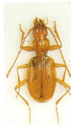
Figure 6 Duvalius laneyrei Ochs 1949.