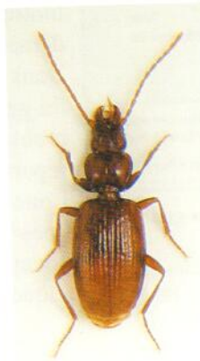
Figure 5 Duvalius convexicollis Peyerimhoff 1904.