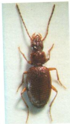
Figure 4 Duvalius muriauxi dellecolleae Giordan 1989.