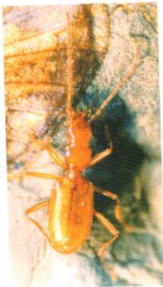
Figure 3 Luraphaenops gionoi Giordan 1984 (photo. A. COACHE).