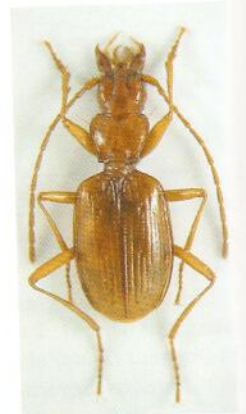
Figure 7 Duvalius (s. str.) maglianoi Giordan-Raffaldi 1983.