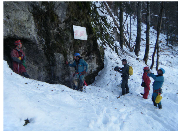
(L'entrée de Megevette)

(A noté que, lors du Week end Chiro annuel, seul le parcours de la traversée classique est prospecté !)